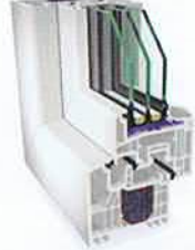
S 7000 IQ plus con profundidad de construcción de 83 mm