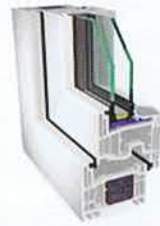
S 8000 IQ con profundidad de construcción de 74 mm