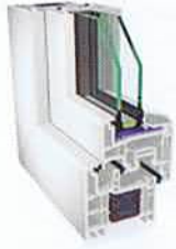
S 7000 IQ con profundidad de construcción de 74 mm

Numerosas geometrías de hoja están disponibles en los siguientes sistemas: