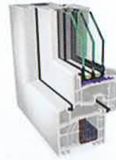
S 8000 IQ plus con profundidad de construcción de 83 mm